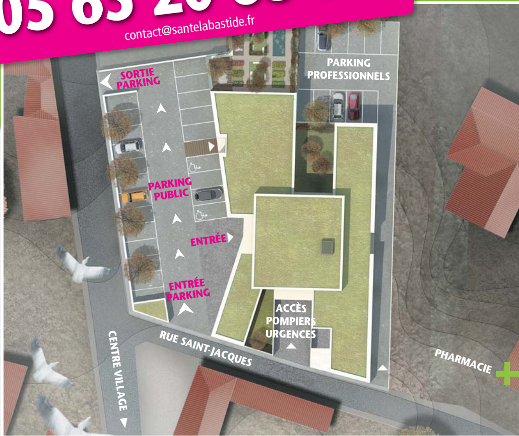
Maison de Santé - 8, rue St Jacques - 46240 Labastide Murat - contact@santelabastide.fr